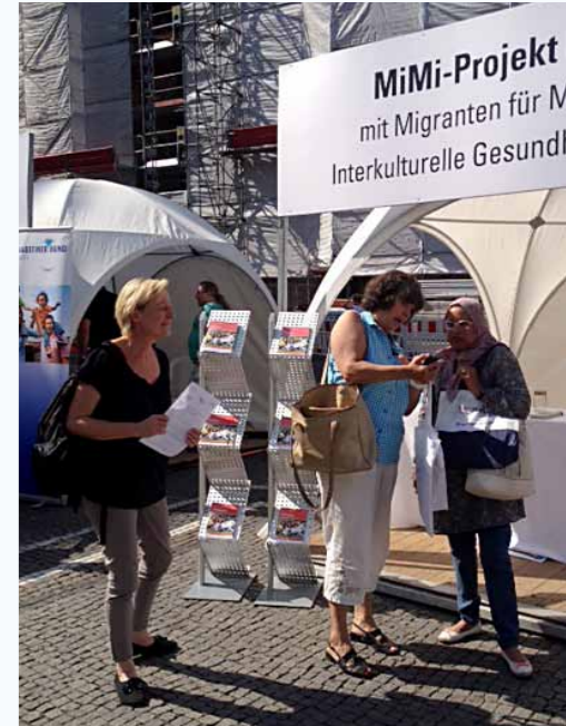
Das MiMi-Projekt auf dem Diabetesmarkt in München

Auf dem Diabetesmarkt, den die Deutsche Diabetes Stiftung organisierte, kamen die MiMi-Mediatoren mit interessierten Besuchern in unterschiedlichen Sprachen zu gesunder Ernährung und den Möglichkeiten, Diabetes mellitus präventiv entgegenzuwirken, ins Gespräch und gaben die mehrsprachigen Wegweiser weiter. Wissen zu Diabetes zu vermitteln war auch das Ziel zweier Gesundheitsaktionen bei der Münchner Stadtentwässerung, die durch das Angebot eines Blutzucker- und Blutdrucktests ergänzt wurden. Vertiefend haben sich die neuen MiMi-Mediatoren Ende letzten Jahres zu diesem wichtigen Thema in einer Schulung weitergebildet.