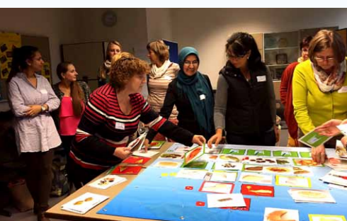
MiMi-Mediatorin und Teilnehmer in Fürth

Mit eigener Migrationserfahrung, dem Wissen über die Ernährungsgewohnheiten ihrer Landsleute sowie über mögliche Zugangshindernisse und Ressourcen konnten die Mediatorinnen als Dialogpartner manche Denkanstöße geben.