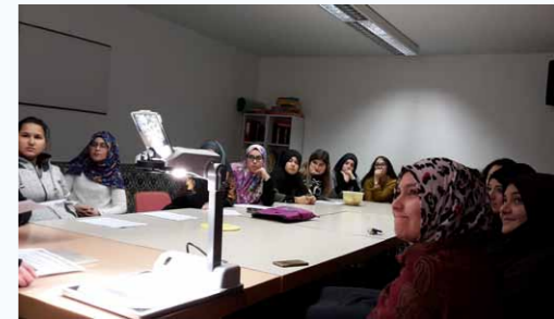
Eine MiMi-Mediatorin erläutert die Wirkweise verschiedener Verhütungsmittel

Bis Ende 2016 wurden 20 MiMi-Informationsveranstaltungen vor Ort durchgeführt.