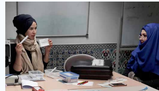
Aufmerksame Zuhörerinnen bei einer türkischsprachigen Veranstaltung zum Thema „Diabetes“