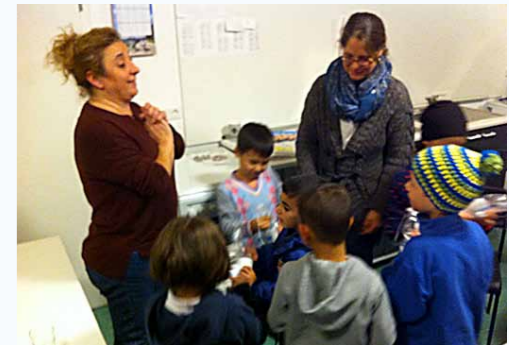
Kinder in einer Unterkunft freuen sich über Zahnpfutzsets, nachdem ihre Eltern zu „Mundgesundheit“ informiert wurden.

Mitte Oktober hat auch hier eine Mediatorengrundausbildung begonnen, die die Mediatoren bereits am 17. Dezember 2016 mit ihrer Praxisübung beendet haben. Ziel war, die Gruppe der Mediatoren zu vergrößern und mit weiteren Sprachen wie Arabisch und Tigrinya zu ergänzen. Nun bereiten sich die MiMi-Mediatoren auf ihre ersten Einsätze vor und freuen sich auch über Anfragen.