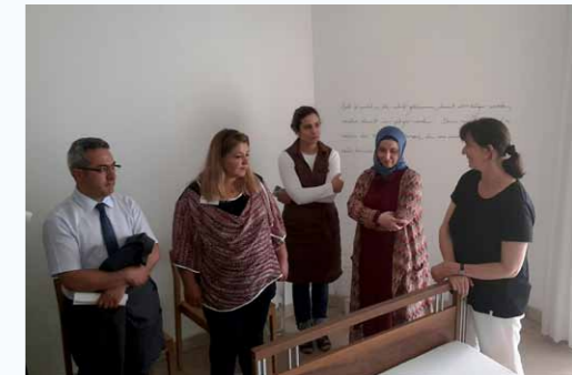
Informationsveranstaltung zu „Palliativ- und Hospizversorgung mit Migranten für Migranten“ im Johannes-Hospiz Pentling