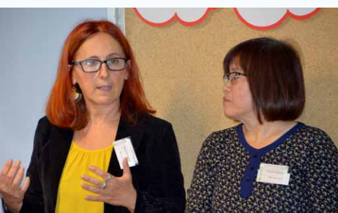
Mediatorinnen aus Landshut in Bad Abbach