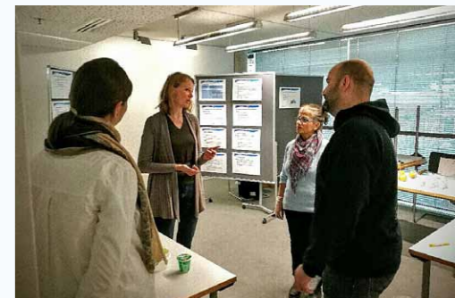
Gesundheitstag bei der Münchner Stadtentwässerung