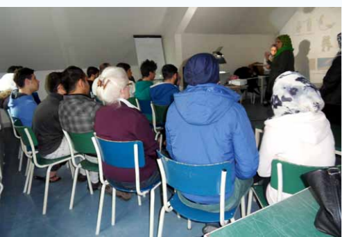
Arabischsprachige MiMi-Veranstaltung zum Thema „Impfen“ in den Conn Barracks