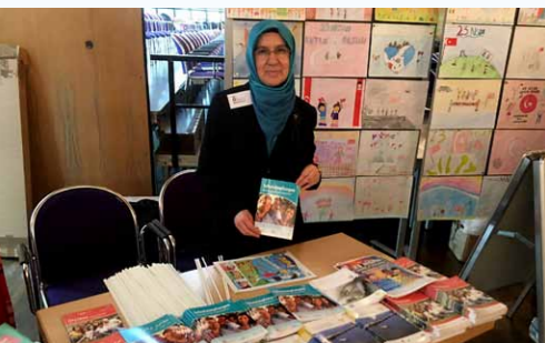
MiMi-Stand beim „Türkischen Kinderfest“