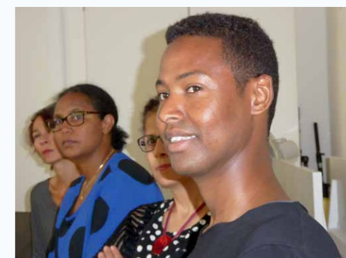
Teilnehmer des Workshops in München

gefördert durch Bayerisches Staatsministerium für Gesundheit und Pflege