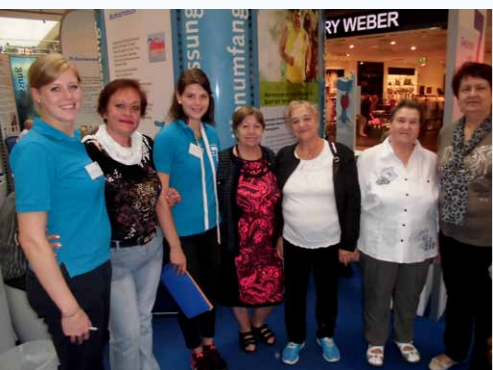
Besuch der Diabetesmesse mit russischsprachiger Gesundheitsgruppe