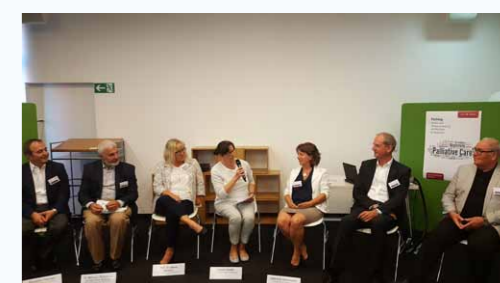
Podiumsdiskussion auf dem Fachtag „Hospiz- und Palliativversorgung mit Migranten für Migranten“