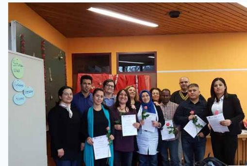
MiMi-Mediatoren bei der Methodenschulung