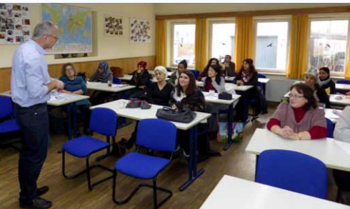
MiMi-Mediatoren bei der Schulung zum Thema „Impfschutz“

Haus International e.V. Poststraße 22 87439 Kempten (Allgäu) http://www.hausinternational.de/