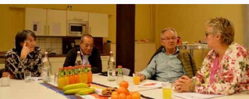
Spezialisierungsschulung zu „Alter, Pflege und Gesundheit“

Seit Dezember stehen die 14 MiMi-Gemeindedolmetscher Ärzten und Beratungsstellen im Stadtgebiet Bamberg gegen ein Honorar zur Verfügung. Der wichtigste Auftraggeber wird die Sozialstiftung Bamberg mit zahlreichen Kliniken und Versorgungszentren sein. Aufträge und Abrechnung werden direkt zwischen Auftraggeber und Gemeindedolmetscher abgewickelt.