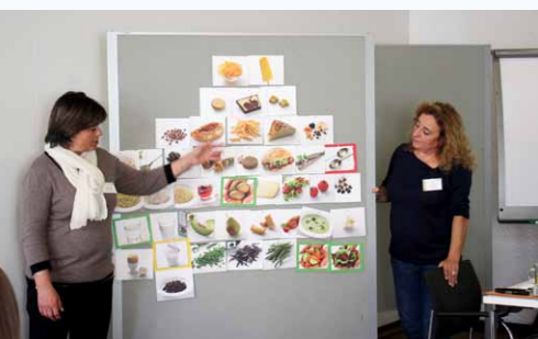
MiMi-Mediatorinnen in Augsburg