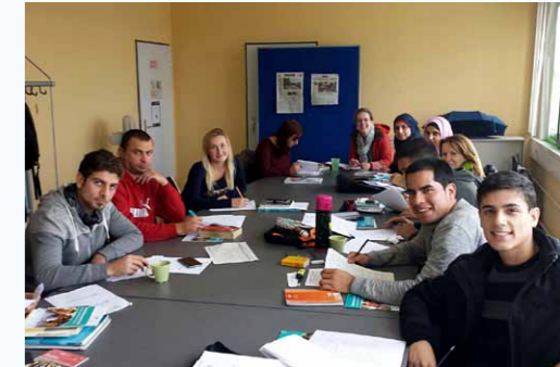
MiMi-Informationsveranstaltung in einem Integrationskurs