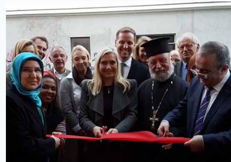
Eröffnung des MiMi-Hub mit Staatsministerin Melanie Huml, Projektförderern, Projektpartnern und MiMi-Mediatoren