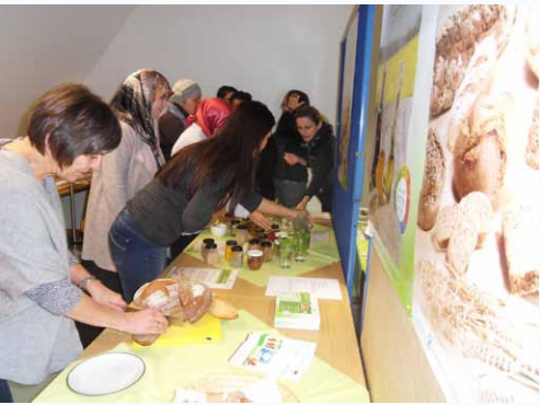
Schulung der MiMi-Mediatoren im Amt für Landwirtschaft, Ernährung und Forsten