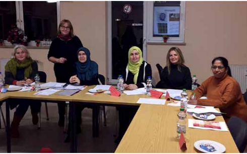
Spezialisierungsschulung zu „Alter, Pflege und Gesundheit“